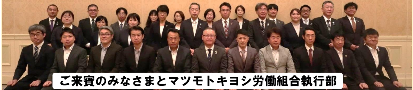
ご来賓のみなさまとマツモトキヨシ労働組合執行部